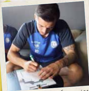
K&A La Gantoise