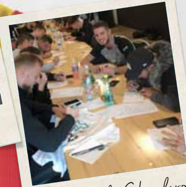
Sporting de Charleroi