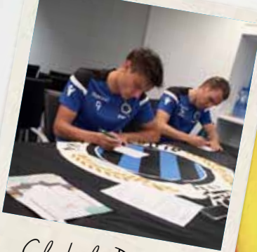
Club de Bruges